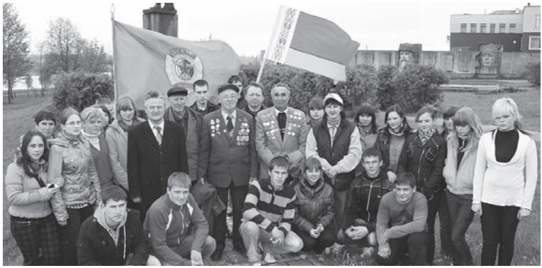
Досоафовцы Копыльщины во время проведения патриотической акции

Недавно Копыльской районной организационной структуре (РОС) ДОСААФ исполнилось 40 лет со дня образования. Она создавалась в 1975 году. Тогда приказом председателя Минского областного комитета ДОСААФ был создан Копыльский районный спортивно-технический клуб, разместившийся сначала в деревне Василевщина. И лишь спустя восемь лет его переместили в центр города.