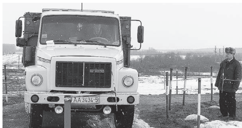
На автодроме Копыльской РОС идут плановые занятия с обучающимися

Копыльская районная оргструктура неоднократно награждалась грамотами Центрального совета ДОСААФ, организационной структуры ДОСААФ города Минска и Минской области, занимала призовые места в месячниках оборонно-патриотической и спортивной рабо-